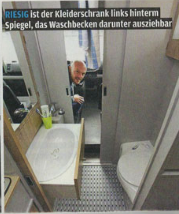
RIESIG ist der Kleiderschrank links hinterm Spiegel, das Waschbecken darunter ausziehbar