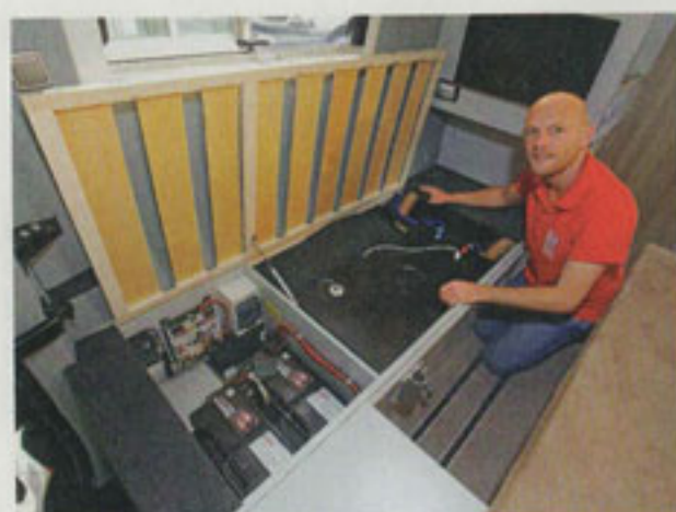
ZENTRAL Heizung, Frischwassertank und Bordelektronik gut zugänglich in der linken Sitzbank