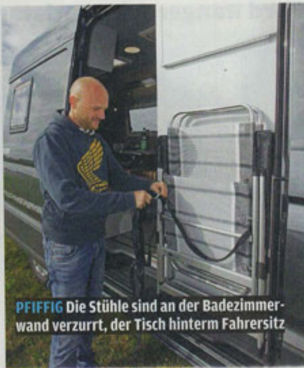
PFIFFIG Die Stühle sind an der Badezimmerwand verzurrt, der Tisch hinterm Fahrersitz