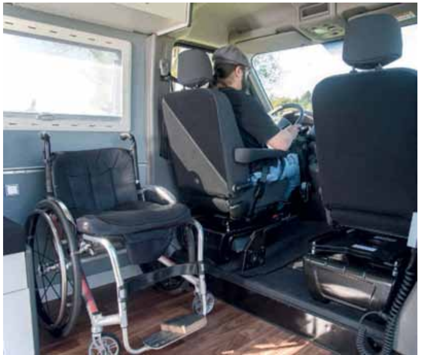
Der Rollstuhl wird hinter dem Fahrersitz positioniert damit man auf den drehbaren Fahrersitz übersetzen kann.